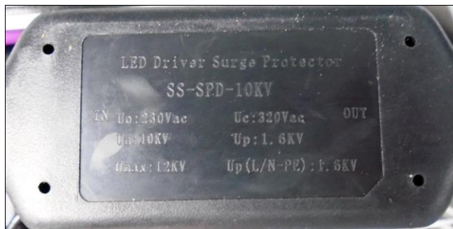
Foto 3. DPS