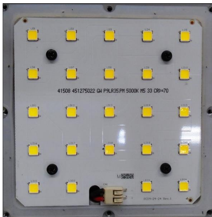
Foto 5. Módulos de LED