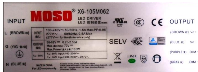
Foto 4. Driver